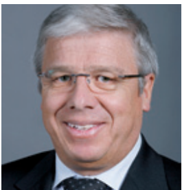
Peter Föhn Co-Präsident des Initiativkomitees, Nationalrat

Die meisten Menschen würden nie eine Abtreibung vornehmen. Sie wollen auch nicht für die Abtreibungen anderer bezahlen müssen.